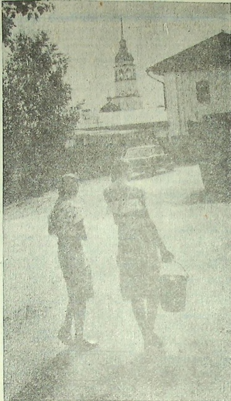
Шла девица за водой.