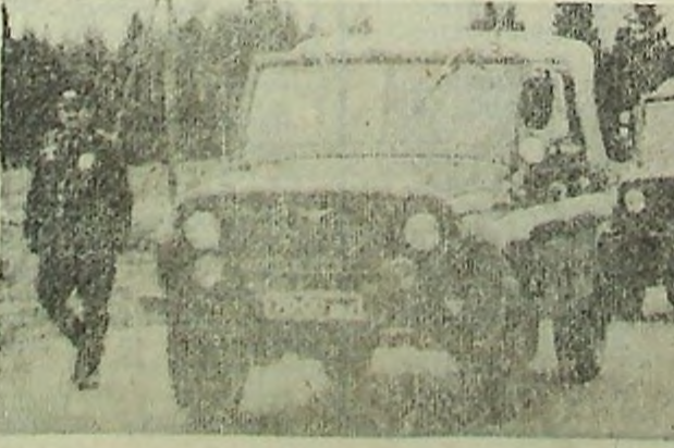
НА СНИМКАХ: телевизор военным дорожным строителям; покрылся асфальтом старинный тракт.

Несколько дней назад на городской площади в торжественной обстановке они принимали воинскую присягу. На обжитом месте им, возможно, уже будет легче служить и работать, нежели их предшественникам, которые начинали с нуля. Но впереди новые километры строительства дорог, и все думают именно о тех больших задачах, которые предстоит еще выполнить, и с волнением слушают слова песни: «По зову великой Отчизны нелегкий достался нам хлеб, гор-