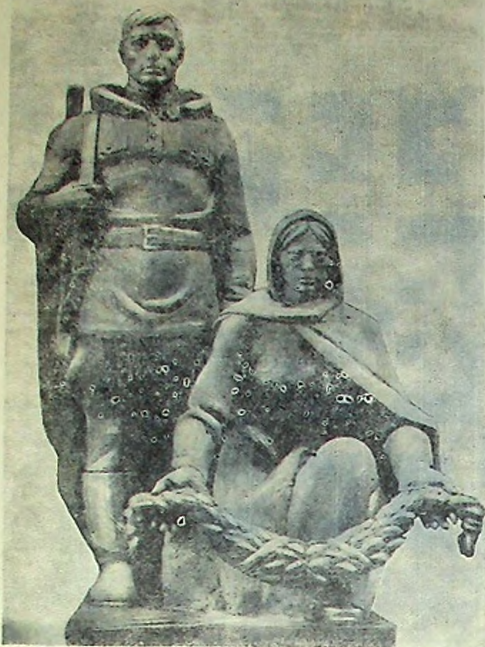
Фрагмент памятника воинам-тотмичам, который будет установлен в саду Борцов за свободу.