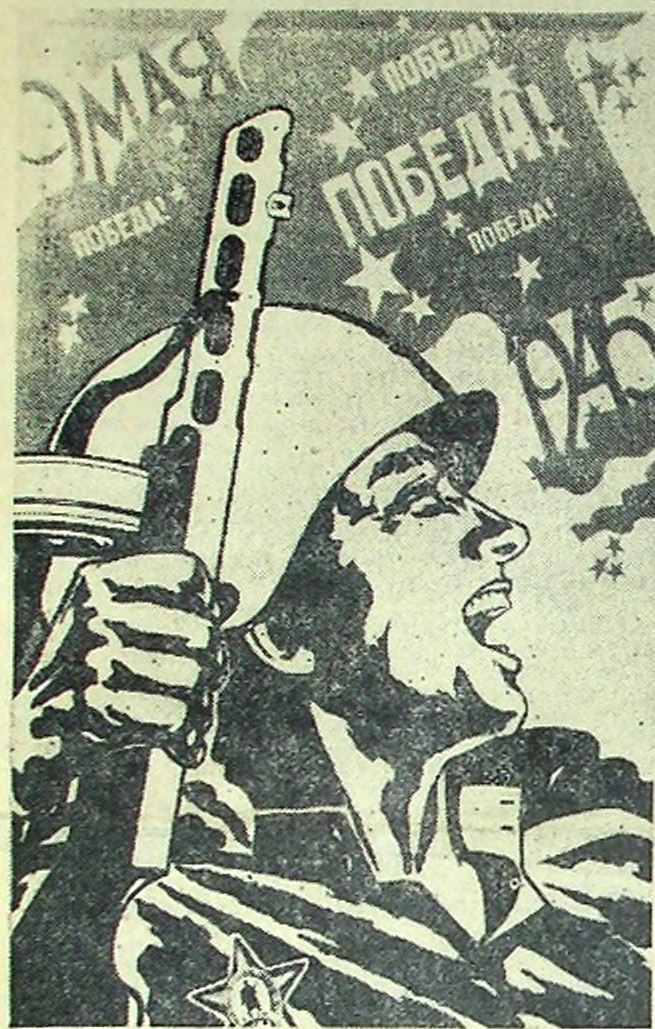
Плакат художника В. Тарасова.

9 Мая — Праздник Победы с ветского народа в Великой Отечественной войне 1941—1945 гг.