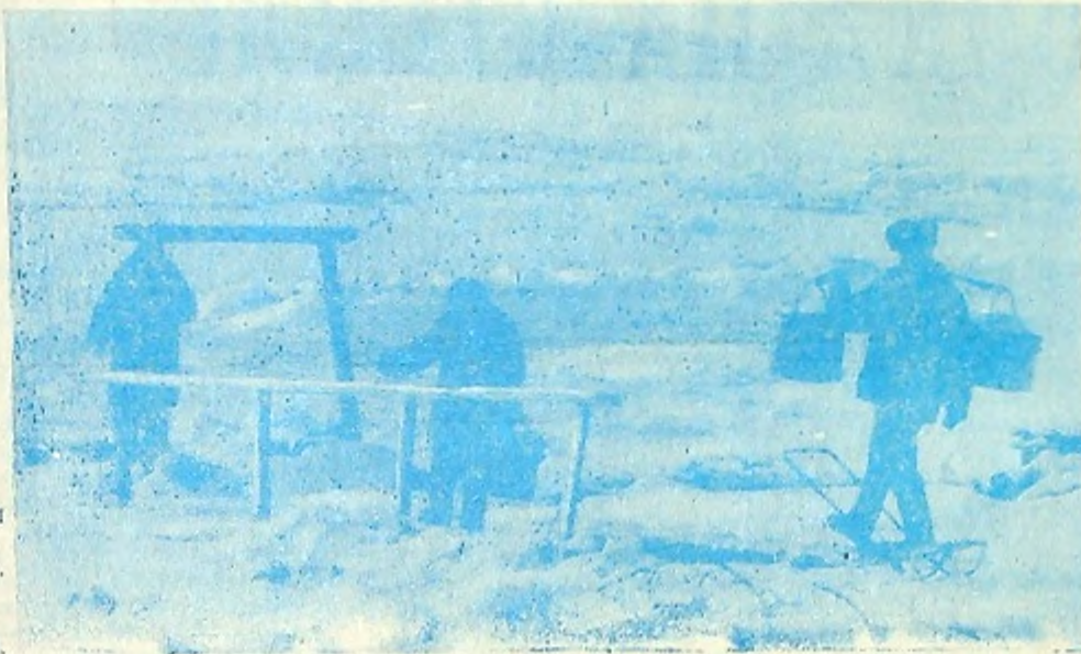
Как и 200 лет назад...

Мороз нарисовал гравюру на стекле. Но печь затоплена, дрова трещат приветно, Приятно посидеть в живительном тепле, И время пролетит легко и незаметно. Вновь ожил старый дом: дым вьется над трубой, В нем искры гаснут, словно микрокосмы. Скрипит мой старый дом, и стерегут покой Его со всех сторон собравшиеся сосны. Вкруг дома моего вершатся чудеса: На голый косогор выходит лось рогатый, Спит заяц под кустом, синее небо. — Я застрахован здесь от боли и утраты. Как речка подо льдом, струится в теле кровь Дремотная, как годы— дни проходят. Идиллия? Да нет, здесь просто милый кров. Румяная заря и личная свобода.