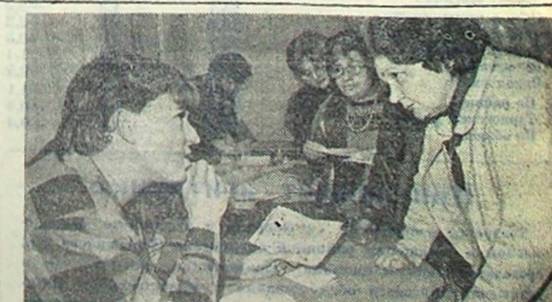
МОСКВА. «Неделя совести», неделя памяти жертвам сталинских репрессий прошла во дворце культуры «МЭЛЗ». Она была организована по инициативе журнала «Огонек».