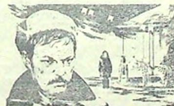
КАРУСЕЛЬ НА БАЗАРНОЙ ПЛОЩАДИ

«Подвиг разведчика» — фильм о советском разведчике Федотове, который благодаря находчивости, хладнокровию, высокому профессионализму совершает ряд крупных диверсий в тылу врага. Ему удается