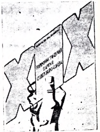
Плакат художников А. Бельского и В. Потапова.

Цель кооператива — работать с прибылью, без оглядки на государственные дотации. И, еще раз повторюсь, все дела в нем решаются на основе широ-