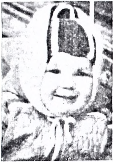
ВЕСЕННЕЕ НАСТРОЕНИЕ