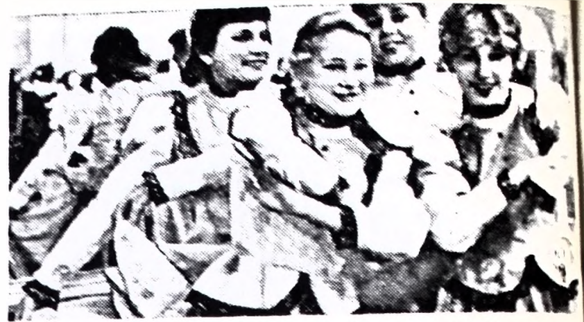
МОСКОВСКАЯ ОБЛАСТЬ. ЛЮБЕРЕЦКИЙ РАЙОН. Клуб колхоза имени В. И. Ленина стал любимым местом отдыха колхозников. В нем проводят досуг 200 участников художе-