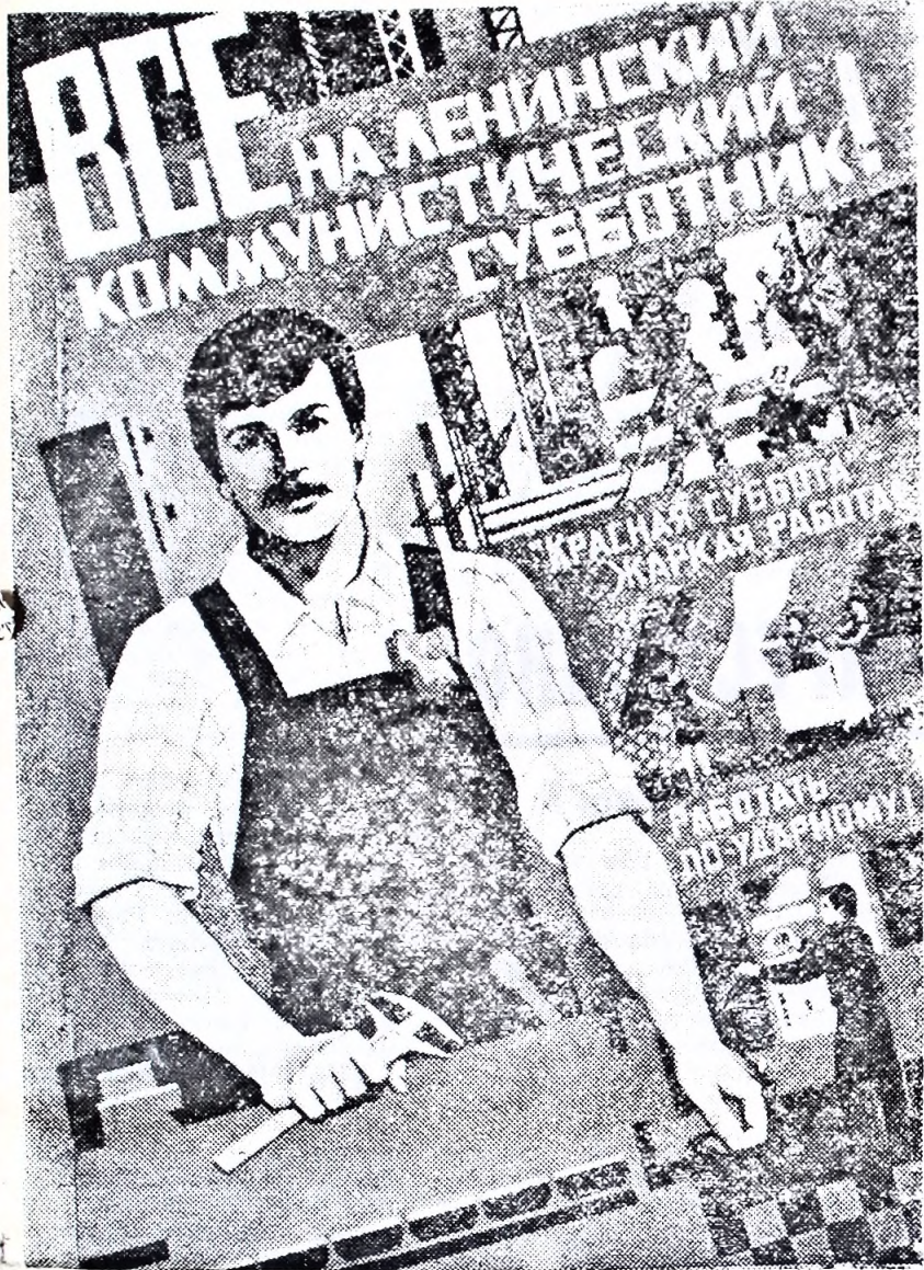
Плакат художника Е. Родионовой.