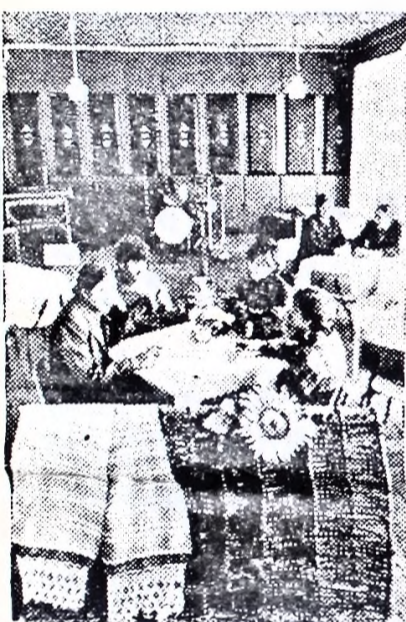
В колхозе «Путь к коммунизму» Свердловского района Орловской области открылось молодежное кафе (на снимке). Две трети работников хозяйства составляет молодежь.