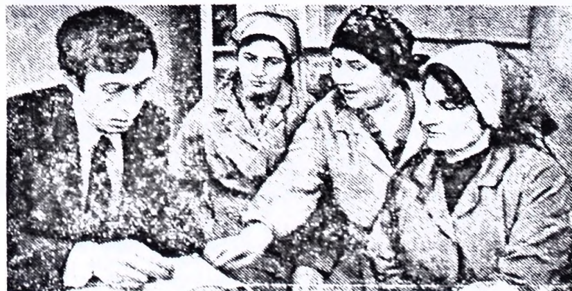
ВОРОНЕЖСКАЯ ОБЛАСТЬ. В колхоз имени Карла Маркса Семилукского района из многих районов Центрального Черноземья приезжают сельские экономисты за опытом.

А поучиться в колхозе есть чему. Вот уже более десяти лет хозяйство работает на самофинансировании и самокупальности.