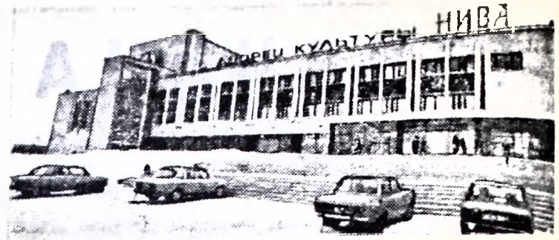
ЛЕНИНГРАД. Поездо физкультурникам совхоза «Шумяры» при Дворце культуры «Нива» для них построен оздоровительный комплекс с бассейном, игровым залом. НА СНИМКЕ: Дворец культуры «Нива».