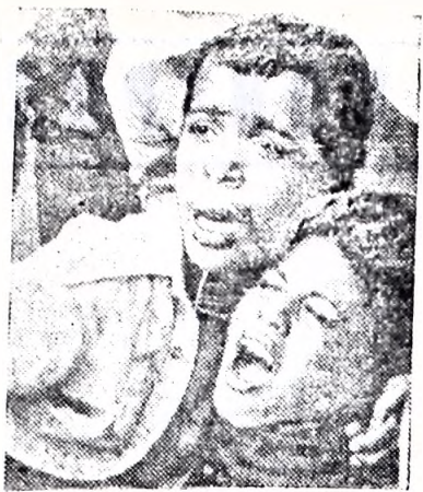
ратели применили слезоточивый газ.

НА СНИМКЕ: участники антиязыльской манифестации в Хан-Юнесе, против которых ка-