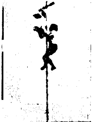
НА СНИМКЕ: столб покорился сильнейшему.