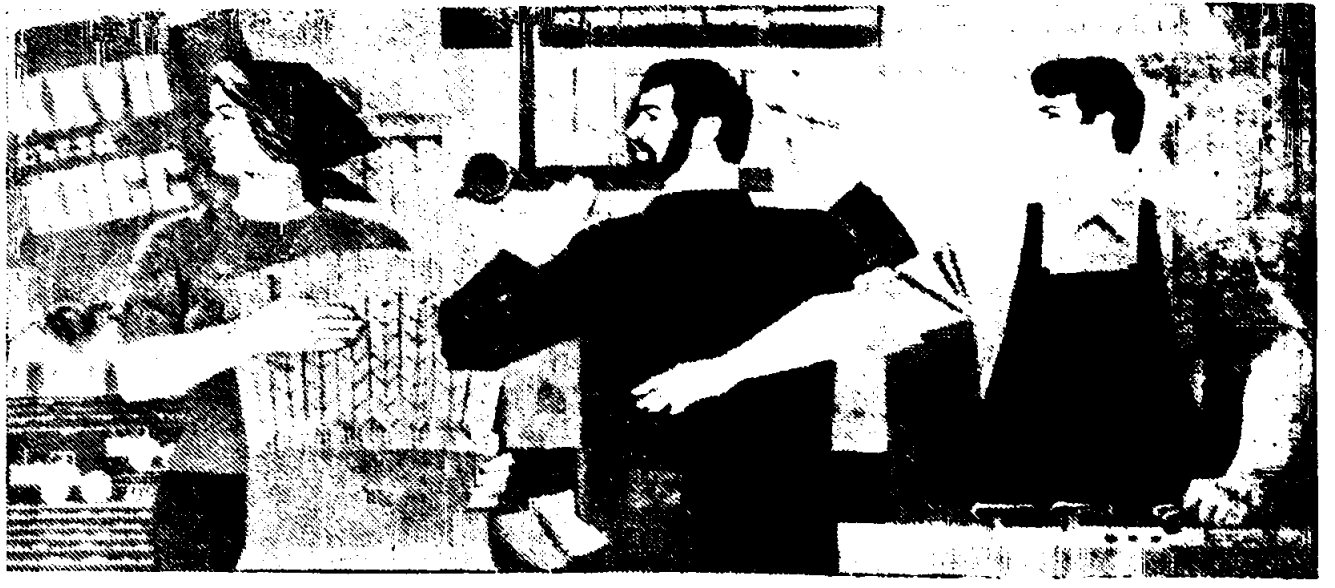
Плакат художника В. Коминарца.

Будем надеяться, что слет передовиков и новаторов станет несомненно полезным и в плане обмена опытом его участников. Что все они не только сами делом откликнутся на постановление ЦК КПСС «Об инициативе трудовых коллективов и передовиков производства по достойной встрече XIX Всесоюзной конференции КПСС», но и личным примером увлекут за собой других тружеников.