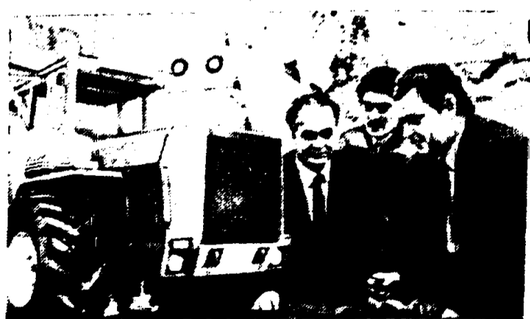
ЛЕНИНГРАД. Успешно выполняет свою главную из определенных на пятилетку задач коллектив производственного объединения «Кировский завод». Здесь идет освоение серийного выпуска нового трактора «Кировец» К-701М. Эта машина по своим характеристикам значительно превосходит выпускаемую сейчас модель: расширена сфера ее применения, увеличена мощность двигателя, улучшены условия труда механизатора. Трактор стал экономичнее, значительно снизилась его металлоемкость.