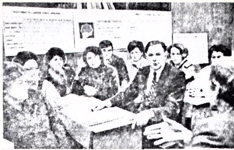
МОСКОВСКАЯ ОБЛАСТЬ. Более 20 тысяч человек трудятся сегодня в агропромышленном комбинате «Раменский». Первые полтора года работы в новых условиях убеждают, что курс на самостоятельность, самофинансирование, самоокупаемость и снижение себестоимости продукции выбран правильно. Итог 1987 года — 43 миллиона рублей прибыли.

Вот я, например, стараюсь лишний раз загрузиться, лишний раз съездить в Вологду — все больше зарабатываем, больше получим. Но помогают ли этому наши агрономическая и зоотехническая службы? Не очень. Почему — то не могут они наладить равномерной работы, без срывов. Не могут в течение рабочего дня выяснить, когда, куда, зачем, кого послать, например, в Вологду. Закончили водители работу, ушли домой — и тут выясняется вдруг, что надо срочно отправлять шофера в Вологду за комбикормами или углем. Заведующий гаражом бежит по домам, ищет кого послать, потом собираем друг у друга талоны на дорогу, в спешке кое-как оформляем документы — доверенность, путевой лист и т. д.