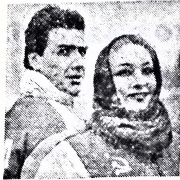
Эти спортивные костюмы созданы для наших «зимних» олимпийцев московскими специалистами общесоюзного Дома моделей спортивной одежды. Такой будет экипировка советских спортсменов на Белой олимпиаде в Канаде.