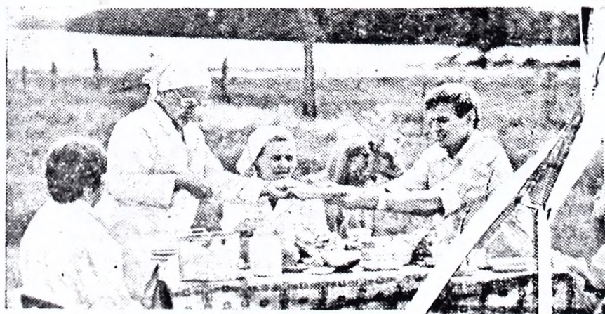
«Ухтинский». Разделяя за столом с доярками нехитрую трапезу, секретарь райкома глубже