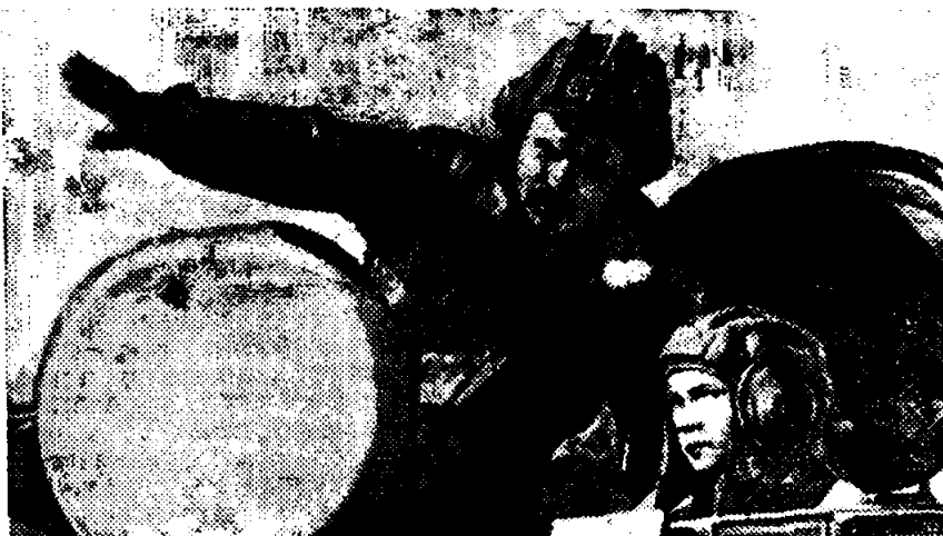
23 ЯНВАРЯ — 80 ЛЕТ СО ДНЯ ОСНОВАНИЯ ДОСААФ СССР

Молодые люди, окончившие перед службой в армии Стрийскую техническую школу ДОСААФ (Львовская область) вспоминают ее добрым словом. Специальность, приобретенная здесь (водитель гусеничных тягачей), помогла им быстрее адаптироваться на воинской службе.