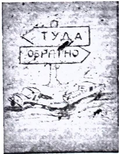
Рис. С. Самодурова.