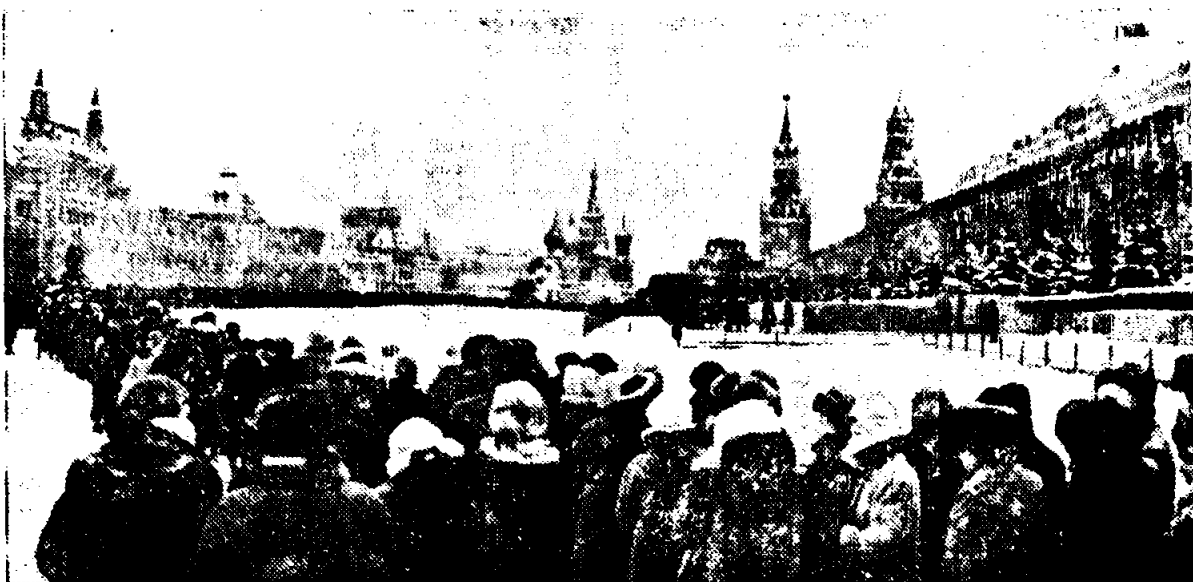
Москва. Красная площадь. К Ленину.

21 января 1924 года — умер Владимир Ильич Ленин