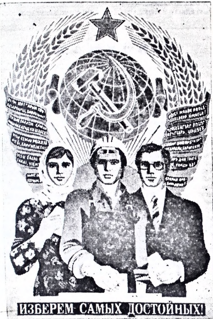
Плакат художника В. Жабского. Издательство «Плакат».