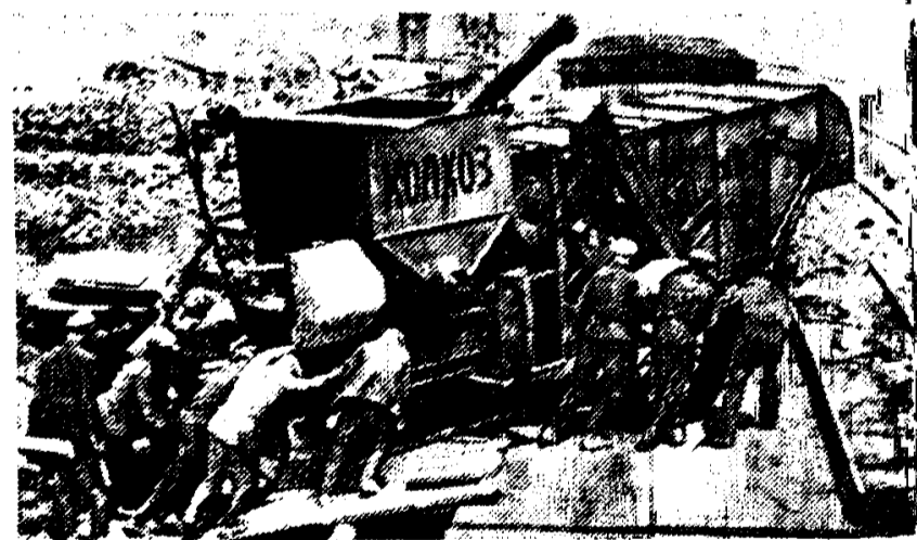
К серийному выпуску комбайнов семейства «Дон» приступило производственное объединение «Ростсельмаш» имени Ю. В. Андропова. 11.500 комбайнов сойдут с конвейера в этом году.