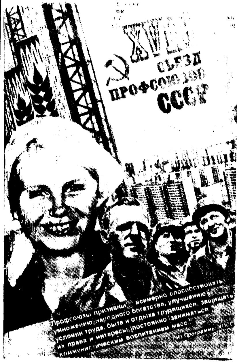
Профсоюзы призваны... всемерно способствовать умножению народного богатства, улучшению условий труда, быта и отдыха трудящихся, защите их права и интересов, постоянно заниматься коммунистическим воспитанием масс... Плакаты художника Л. Тарасовой. Издательство «Плакат».