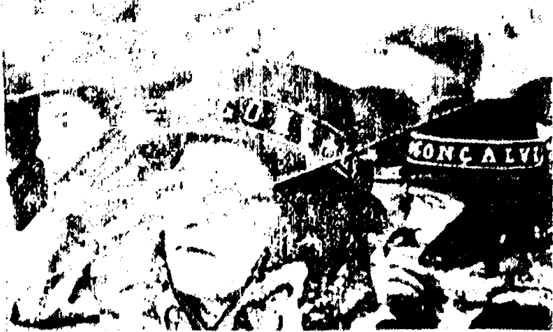
В Португалии усиливаются выступления трудящихся в защиту одного из главных завоеваний демократической революции 1974 года — аграрной реформы. НА СНИМКЕ: манифестация крестьян юга Португалии в Лиссабоне.