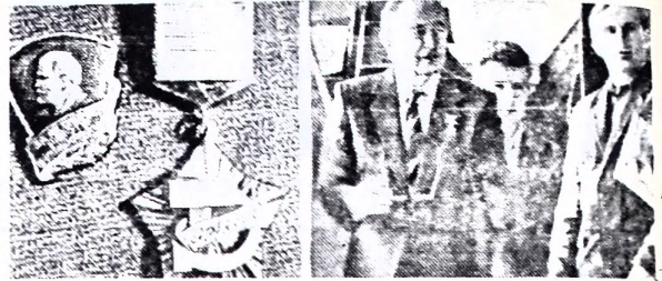
и ЦК ВЛКСМ «Наставник молодежи»; председатель областного совета наставников проректор Оренбургского сельскохозяйст-

НА СНИМКАХ: более 30 наставников Оренбургской области награждены знаком ВЦСПС