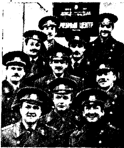
КАДРЫ ДЛЯ МИЛИЦИИ

Направлять с комсомольской путевкой на работу в органы внутренних дел лучших рабочих и воинов после их срочной службы в рядах Советской Армии стало традицией в Новгороде. С нелегким, но почетным трудом защитников правопорядка они знакомятся в Учебном центре УВД облисполкома. Опытные преподаватели помогают новому пополнению изучить технические средства, которыми оснащена сегодня милиция, познать патрульно-постовую службу, приобрести глубокие политические знания.