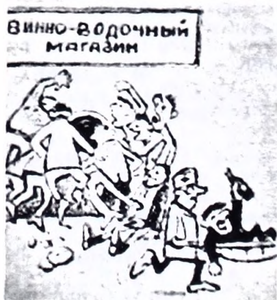
— Все в порядке! Бутылочку достал! Рис. С. Самодурова.