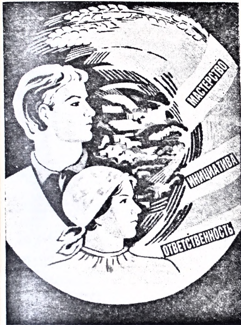
Плакат художника Н. Сахаровой.