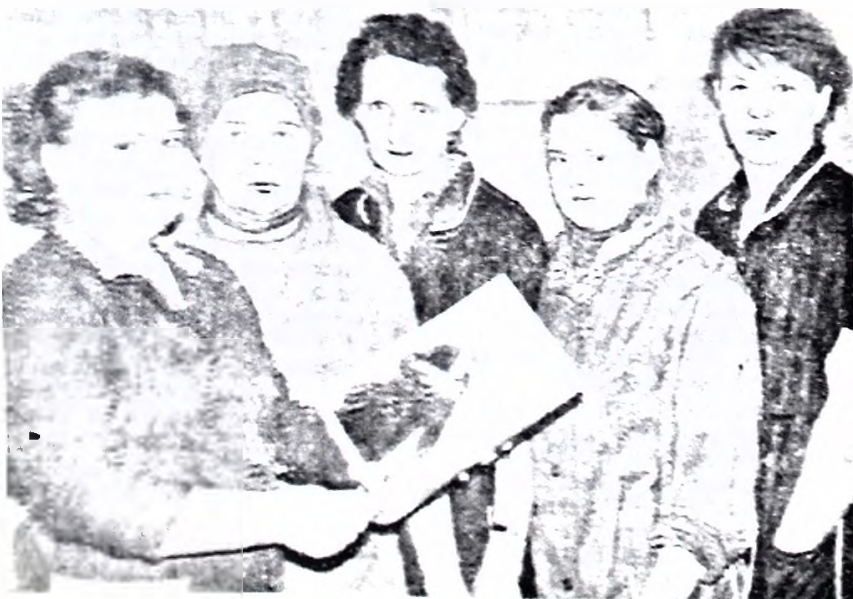
НА СНИМКЕ: группа доярок фермы Задняя.