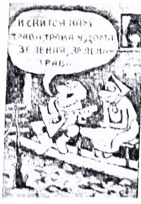
Рис. С. Самодурова.

Дорогие наши читатели, ждем от нас писем. Ваши предложения, критические замечания помогут нам и работе, помогут сделать газету более интересной и эффективной.