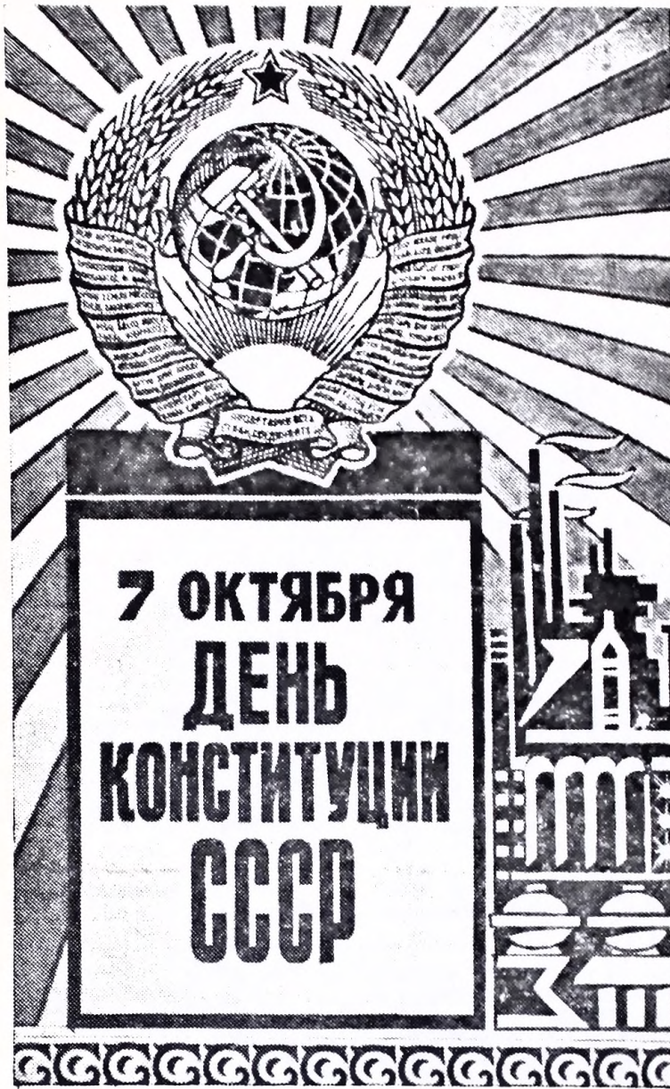
Плакат художника Ю. Кершина.

Развертывая демократию, партия дает тем самым верное направление процессу углубления социалистического самоуправления народа, участия каждого человека в делах страны.