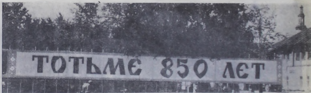
На праздничной площади.