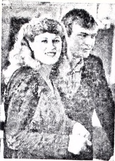
Строители из братской Белоруссии торжественно передали земледельцам Псковской области новый совхоз, который назван «Белорусским». Совхозный поселок отличается необыч-

Этот стенд пользуется вниманием москвичей и многочисленных гостей столицы. В. БЕЛЕНЬКИЙ, член Союза журналистов СССР.