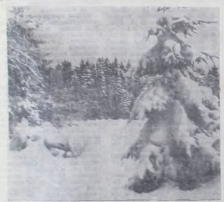
Зимний пейзаж.

дителей хозяйств, специалистов принятия экстренных мер по вывозке на поля компостированных органических удобрений. Особое значение насаждению, вывозке и внесению органических удобрений в годы двенадцатой пятилетки должны придавать руководители и специалисты всех хозяйств района. Если за годы десятой пятилетки на один гектар в районе было внесено по 6,6 тонны органических удобрений, то в годы одиннадцатой пятилетки только по 5,2 тонны. Хуже того, увеличивал внесение минеральных удобрений без соответствующего роста доли органики мы закисляем площадь пашни. Для улучшения охраны природы и рационального использования ее ресурсов необходимо повсеместно усилить организаторскую работу советских и хозяйственных органов, руководителей предприятий, организаций, колхозов и совхозов района. Сознанием важности этого дела должен проникнуться каждый советский человек. В. ВИНУКОВ, председатель президиума совета районной организации общества охраны природы.