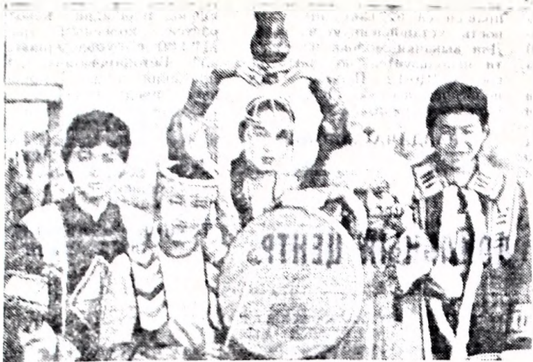
ТЫНДА. В гостях у строителей и эксплуатационников Байкало-Амурской железнодорожной магистрали побывал лауреат премии Якутского комсомола, участник XII Всемирного фестиваля молодежи и студентов в Москве ансамбль «Чэчир» («Росток») якутского Дворца пионеров. Концерты в поселках на трассе и в оленеводческих совхозах, на предприятиях, в школах заканчивались митингами дружбы народов СССР, сбором подписей в защиту мира. НА СНИМКЕ: артисты ансамбля «Чэчир» в Тынде.