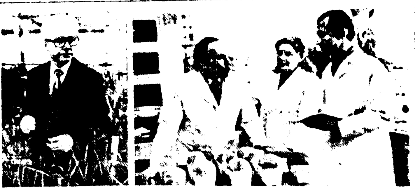
Одесса. За годы XI пятилетки коллектив Всесоюзного селекционно-генетического института создал 88 новых сортов и гибридов пшеницы, ячменя, кукурузы, подсолнечника и других культур.

Сейчас институт организует широкие целевые исследования по клеточной селекции, генно-хромосомной инженерии, биохимической генетике. Разрабатываются новые методы оценки селекционного материала. Использование методов биотехнологии уже дало первые результаты: созданные на этой основе сорта ячменя «Исток» и «Одесский-115» переданы в государственные сортоиспытания.