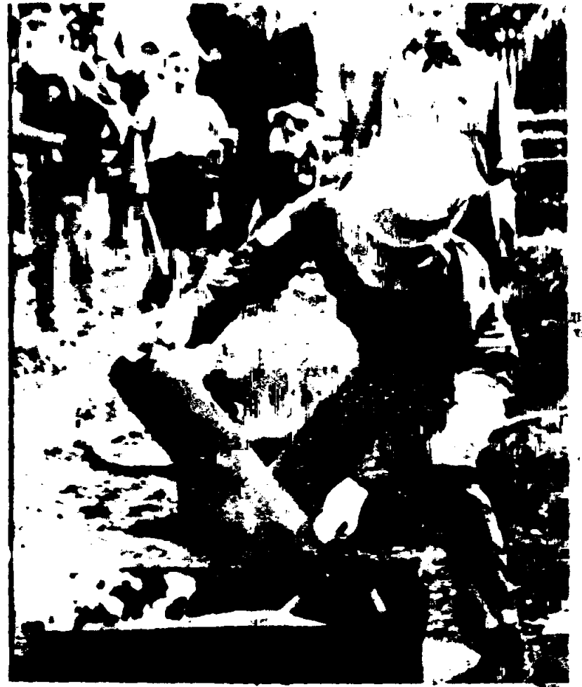
НА СНИМКЕ: момент соревнования юных пожарных.