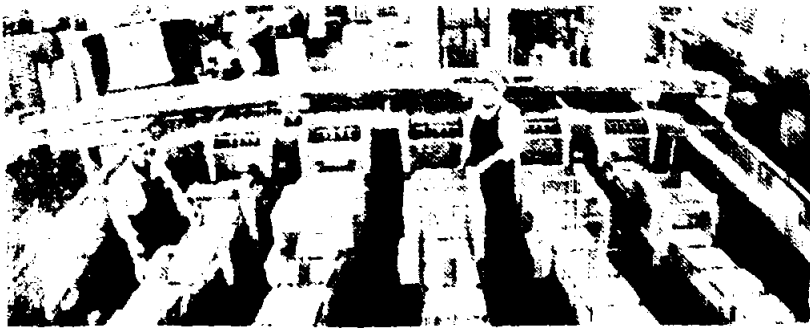
МОСКОВСКАЯ ОБЛАСТЬ. На Высоковской птицефабрике Глебовского ордена Трудового Красного Знамени производственного птицеводческого объединения создан цех-автомат. Здесь 400 тысяч кур-несушек обслуживает подрядная бригада из десяти человек — птичники-операторы и слесари-операторы. Годовой экономический эффект от введения в строй этого цеха составляет 460 тысяч рублей в год. При этом высвобождено 24 человека.

Н. НОВОСЕЛОВ, секретарь парторганизации Сухонского леспромхоза.