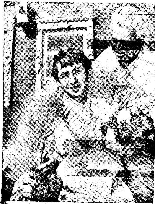
16 НОЯБРЯ — ДЕНЬ РАБОТНИКОВ СЕЛЬСКОГО ХОЗЯЙСТВА И ПЕРЕРАБАТЫВАЮЩЕЙ ПРОМЫШЛЕННОСТИ АГРОПРОМЫШЛЕННОГО КОМПЛЕКСА