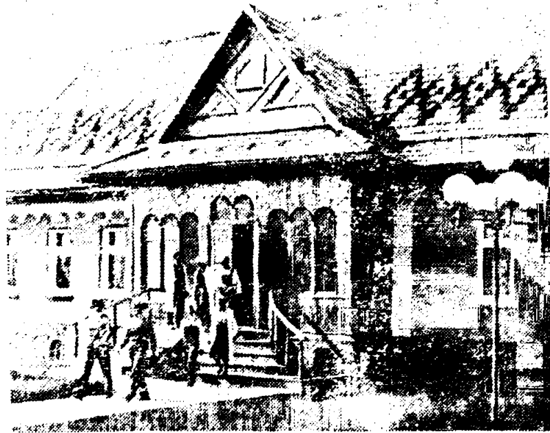
МОЛДАВСКАЯ ССР. Уютные комнаты отдыха, столовая, красный уголок, сауна, лечебный профилакторий — все эти удобства предоставлены к услугам работников молочного комплекса колхоза имени Чапа-

ева Фалештского района в новом Доме животноводов. Создание благоприятных условий для отдыха — это один из факторов, влияющих на успешную работу коллектива. В хозяйстве многое сделано для сниже-