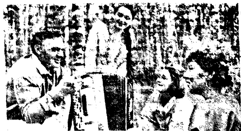
ВЛАДИМИРСКАЯ ОБЛАСТЬ. Более половины воспитанников школ, расположенных на усадьбах ордена Трудового Красного Знамени госплемзавода «Пролетарий», остаются работать на родной земле. Специалисты помогают ребятам еще за школьной партией приобрести профессии, необходимые хозяйству.

Хорошо трудится комсомольско-молодежный коллектив нового животноводческого комплекса, где внедрена поточно-цеховая система получения молока и выращивания племенных животных. Вместо трех лет по плану его освоили за год. Обязательства по надоям перевыполняются. До конца года от каждой фуражной коровы будет получено по 1800 килограммов молока.