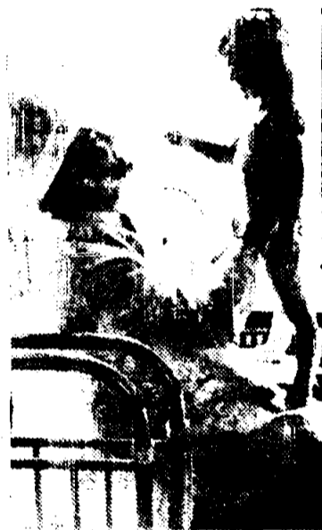
КИШИНЕВ. Регулярные занятия физкультурой в детском саду «Теремок» укрепляют здоровье детей и значительно снизили количество простудных заболеваний.