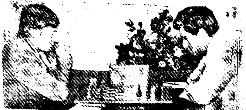
ЛОНДОН. Матч-реванш за звание чемпиона мира по шахматам между чемпионом мира Гарри Каспаровым и экс-чемпионом Анатолием Карповым.