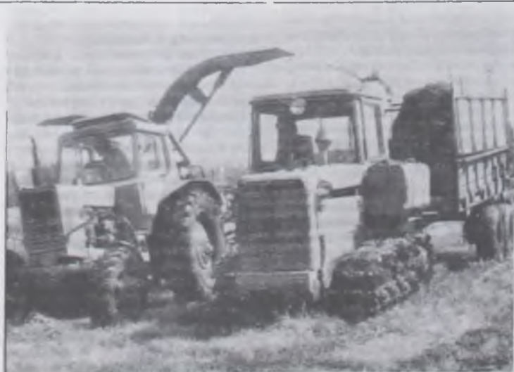
НА СНИМКЕ: идет заготовка кормов в колхозе имени Ленина.

Г. АЛЫКОВА, вязальщица трикотажного ателье.