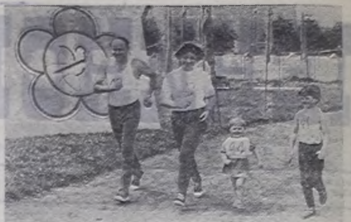
Трезвость — норма, пьянству — бой!

На сцене происходила драма. Спивался в компании друзей бывший боксер, мастер спорта. Его жена в последней надежде обратилась к врачу-наркологу. Что будет дальше? По-может ли медицина вернуть человека на правильный путь? Этот вопрос мысленно задавали себе зрители, которые сами проходили курс лечения от алкоголизма в дневном наркологическом стационаре при московском заводе «Тизрибор».