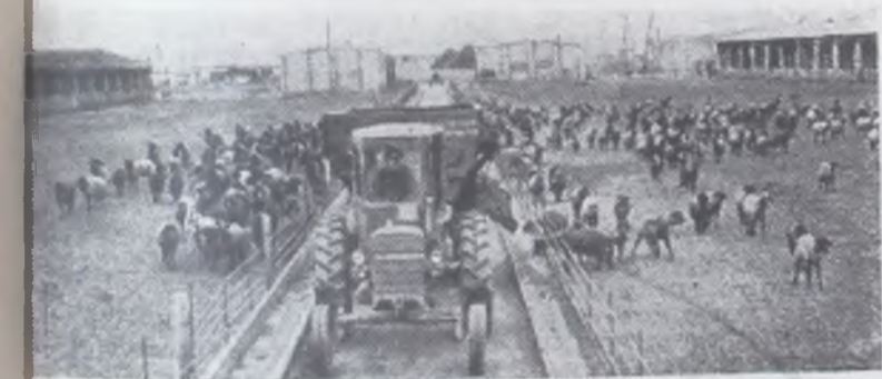
ТУРКМЕНСКАЯ ССР. В XI пятилетке начал работать и продолжает строиться Кызыл-Арватский животноводческий совхоз-комплекс. Сейчас на откорме находится 20 тысяч овец. Здесь внедрена индустриальная технология, труд чабана-оператора механизирован. НА СНИМКЕ: механизированная раздача кормов в совхозе.

С 15 сентября перевести животных на зимние рационы. Социалистические обязательства приняты на собраниях коллективов животноводов района.