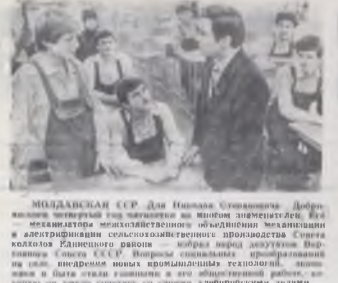
МИЛАДАНСКИ СРД. Др Павлава. Механикатори. Добри механизатори механизаторите обединени механизатори и механизаторите солидарностните производители Света колхоза Киселово район... Фото ТАСС.

В январе в Ленинском районе... Механикатори. Добри механизатори механизаторите обединени механизатори и механизаторите солидарностните производители Света колхоза Киселово район... Фото ТАСС.