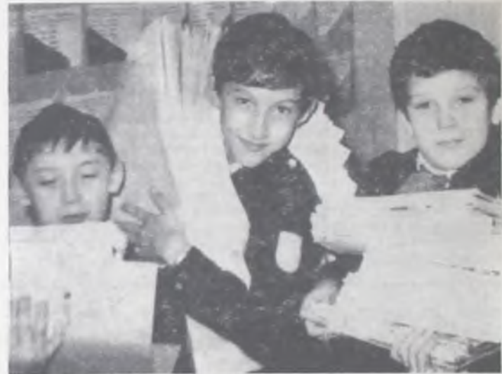
Мы и реформа