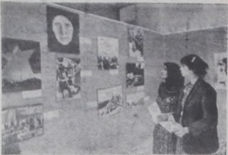
КУВЕИТ. Большой интерес общественности страны вызвала фотовыставка ТАСС «Политика СССР: мир, сотрудничество, дружба». НА СНИМКЕ: в одном из залов фотовыставки.

Каждый день из различных западноевропейских столиц поступают сообщения, свидетельствующие о твердом намерении миролюбивой общественности не допустить осуществления опасных для дела мира планов США и НАТО по дальнейшему размещению на территории ряда стран Западной Европы новых американских ядерных ракет первого удара. Демонстрации протеста, митинги и собрания, организация «лагерей мира» близ военных баз свидетельствуют о решимости участников антивоенного движения бороться против превращения стран Западной Европы в «ядерных заложников», США, за срыв поджигательских замыслов милитаристов и содействие тем самым успеху предстоящих советско-американских переговоров по космическим и ядерным вооружениям.