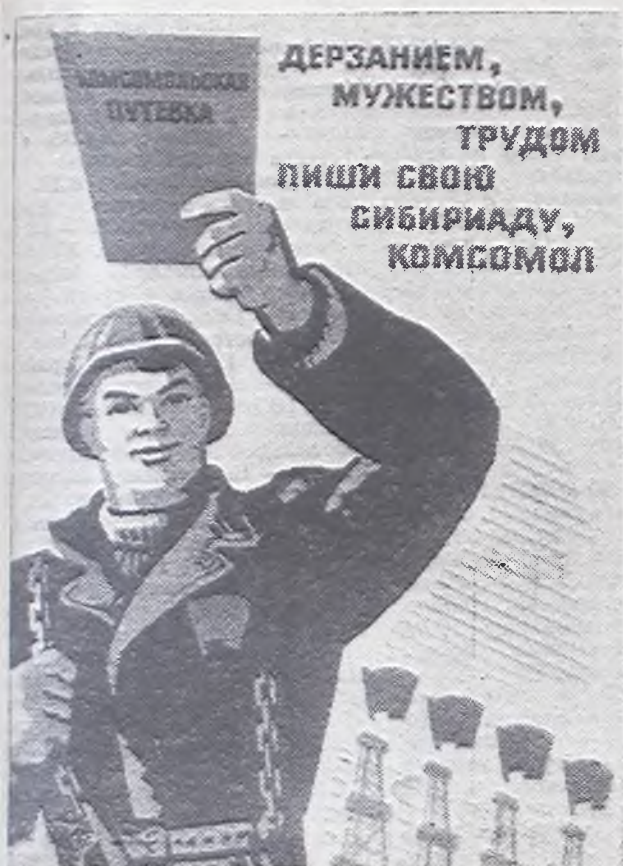
Плакат художника Г. Гаусмана.