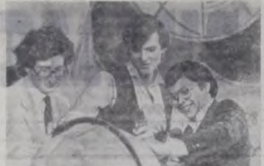
МОСКВА. На Центральном телевидении закончилась съемка первой большой телевизионной программы из цикла «Салют, Фестиваль!», организованной советским подготовительным комитетом XII Всемирного фестиваля молодежи и студентов совместно с Главной редакцией телепрограмм для молодежи Гостелерадио СССР.

В съемках первой передачи приняли участие активисты фестивального клуба ЧСР, интернациональные группы студентов МГУ и молодые рабочие БАМА, общественные деятели, артисты.